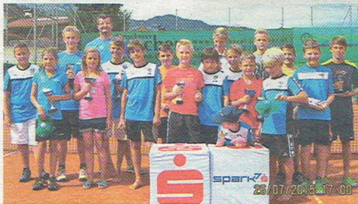
Die Gewinner des TC Sparkassen Oberndorf Cups.

Der Vorstand des TC Sparkasse Oberndorf gratuliert den Gewinnern und bedankt sich zugleich bei allen Teilnehmern und Helfern.