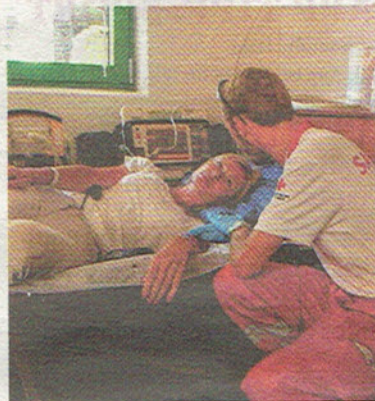
Das Team vom Roten Kreuz reagierte beim Zwischenfall schnell und kompetent.