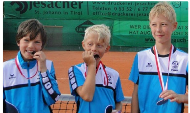
Dritter Platz bei der Tiroler U10-Mannschafts-Meisterschaft