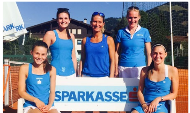
Die TCO Damenmannschaft